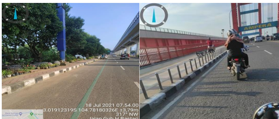
Gambar 3. Kondisi Perkerasan Jalan

Peringkat kondisi perkerasan (P c ) di Jalan sepanjang rute Jakabaring Sport City - BKB yaitu Jl. Gub. H. Bastari – Jl. Mayjend Ryacudu – Ampera – Jl. Merdeka – BKB (Gambar 3) sesuai Survey kondisi jalan bernilai 3 yang artinya kondisi perkerasan jalan cukup baik (sedang).